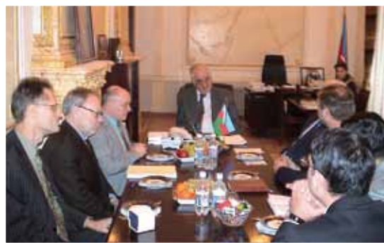
Baptistdelegation besöker religionsministern i Azerbajdzjan.

Baptistsamfundet i Azerbajdzjan har cirka 3 000 medlemmar, som får utstå förföljelser och inskränkningar i religionsfriheten. Svenska Baptistsamfundet förmedlar, i samverkan med Ljus i Öster, stöd till tre evangelister som reser runt