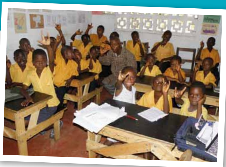
I Monrovia finns en skola för döva med elever i åldrarna 6-25 år.

evangelisation, undervisning och omsorgsarbete. De driver 99 skolor, från förskola till universitetsnivå. En av dessa skolor som stöds av Metodistkyrkan i Sverige är "Hope for the Deaf School" i Monrovia med 43 döva barn upp till årskurs 6 (i åldrarna 6 till 25 år). Teoretisk utbildning varvas med hantverk för att ge möjligheter till framtida egen inkomst. Stöd har bland annat gått till lärarlöner, visuella hjälpmedel, skrivmaskiner och annan utrustning för eleverna samt fortbildning för lärare.