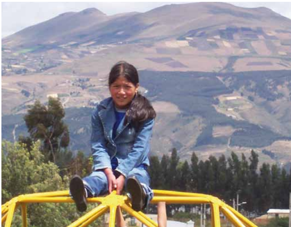
I Ecuador ansvarar lokala församlingar för skolor på sin ort. Här en bild från en skolutflykt till en lekpark.