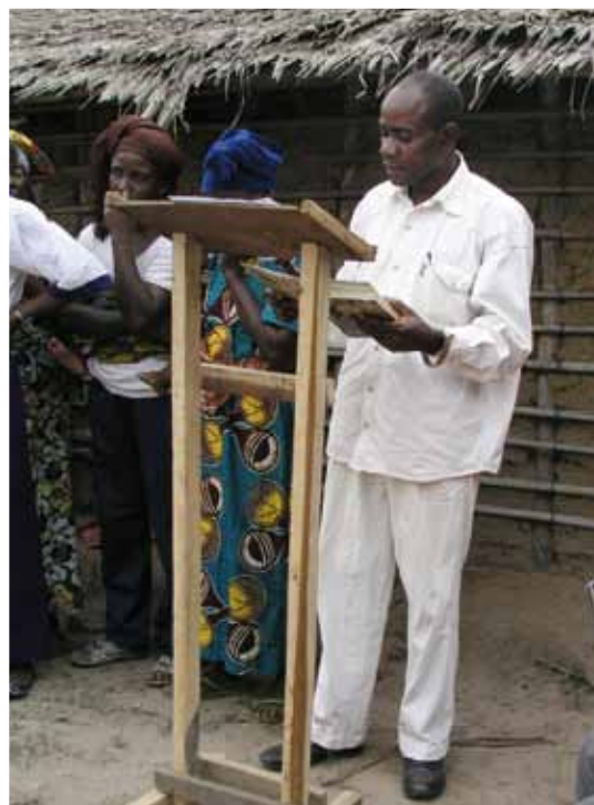
Evangelisation och församlingsutveckling är en del av det arbete som EEC bedriver i Kongo-Brazzaville.

Communauté des Eglises Baptistes Unies (CEBU) har cirka 30 000 medlemmar, 70 lokal-församlingar och ett stort antal utposter. Förutom evangelisation, församlingsplantering, barn-, kvinno- och ungdomsarbete bedriver CEBU