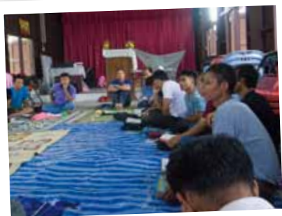
Utbildning av karenevangelisterna i Thailand.

Att förmedla budskapet om Jesus Kristus så att människor kan komma till tro och få en personlig relation till Jesus är den kristna kyrkans och missionens huvuduppgift. Hur det sker är väldigt olika beroende på var i världen människorna bor. Du kan genom ditt bidrag till Baptistsamfundet, Metodistkyrkan och Missionskyrkan medverka till att sprida evangelium, utbilda pastorer och evangelister, starta husförsamlingar med mera i många länder runt om i världen där samarbetskyrkor finns.